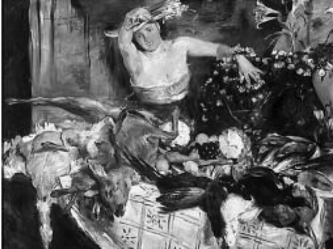
Lovis Corinth: Geburtstagsbild für Charlotte