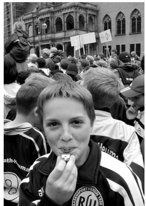
Die PDS Offene Liste unterstützte die Sportdemo gegen die Kürzungen beim Breitensport

Bereits jetzt gibt es rund um den Köln-Bonner Flughafen zahlreiche Unternehmen mit großem Lohngefälle. Durch eine Betriebsaufspaltung wird diese Entwicklung völlig enthemmt. Wenn eine derartige Betriebsaufspaltung eines öffentlichen Unternehmens Schule macht und gleiche Arbeiten ungleich bezahlt werden, wäre das ein zentraler Angriff auf das gesamte Tarifgefüge des Öffentlichen Dienstes und eine Aufspaltung öffentlicher und kommunaler Unternehmen.