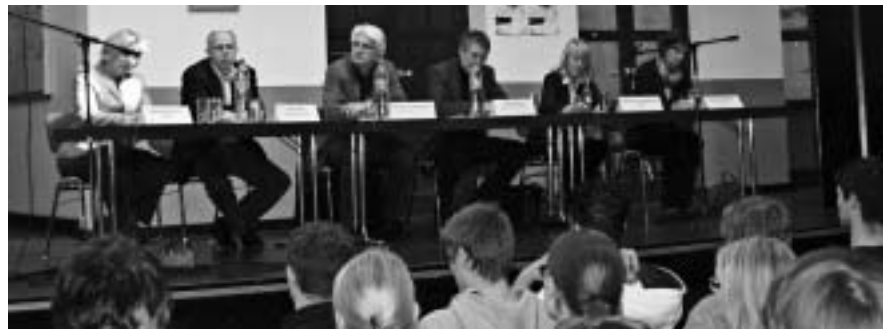
Am Hölderlin-Gymnasiums fand ein Workshop und Rechtsextremismus statt und eine anschließende Diskussion mit Parteienvertretern aus dem Deutschen Bundestag

Verschieden Workshops für Jugendliche und Erwachsene befassen sich beispielsweise mit Formen des Rechtsextremismus und des Rechtspopulismus in Köln. Entgegen dem Selbstbild der Kölner, dass ihre Stadt aufgrund seiner toleranten und multikulturellen Einstellung praktisch Nazi-frei ist, betreiben neonazistische und rechtspopulistische Gruppen auch hier ihre Propaganda und haben damit in begrenztem Rahmen auch Erfolg. In Köln wie auch in anderen auch in anderen Kommunen in