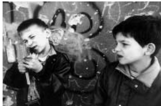
Roger LeMoyné „Flüchtlinge aus Bosnien und Herzegowina, 1994“

Anlässlich der Veranstaltung überreichte PDS/OL-Ratsmitglied Senol der Flüchtlingskommissarin einen offenen Brief zur Situation der Flüchtlinge in Deutschland. Sie schilderte, dass Bosnien- und Kosovo-Flüchtlinge oft bei Nacht und Nebel abgeschoben werden. Für kurdischen Flüchtlinge wurde lange Zeit der Aufenthalt in Kirchenasylan geduldet. Mittlerweile bie-