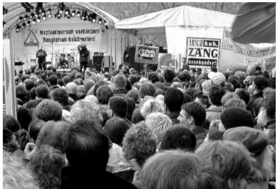
Demonstration der 25 000 gegen Neofaschismus und (alltäglichen) Rassismus

Wir wünschen unseren Leserinnen und Lesern erholsame Weihnachtstage und ein gutes Neues Jahr