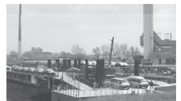
Niehler Hafen II