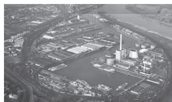
Niehler Hafen I